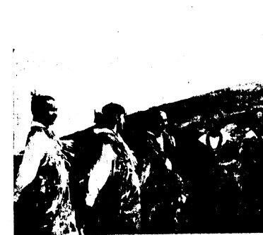
Uroczce dziewczęta z "Białego Orła" w strojach góralskich.