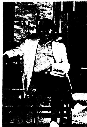
Senator Stanley Haidasz na trybunie honorowej.