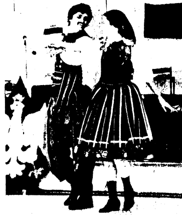
Dorodna para z zespołu "Cracovia" z London w kujawiaku.