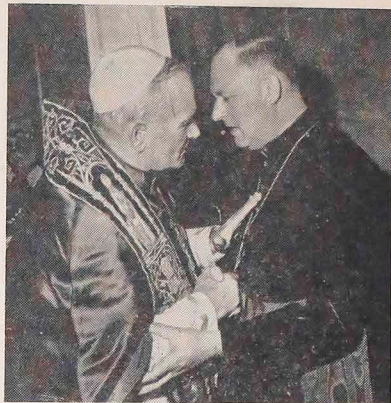
Ojciec św. Jan Paweł II weźmie udział w konferencji CELAM w Pueblu-Meksyku. Jego obecność na tej konferencji będzie decydująca, by znaleźć wspólną drogę dla biskupów tradycyjistów i kierujących się duchem II Soboru Watykańskiego, odmownie problemów społecznych. Na zdjęciu Ojciec św. w rozmowie z arcybiskupem Fortalezą - kardynałem D. Aloisio Lorscheider - jednym z 3 koordynatorów Konferencji w Pueblu.

Już teraz prasa światowa zajmuje się tematem przemówień Ojca św. przypominając, że wziął on czynny udział w opracowaniu dokumentu apostołskiego ogłoszonego przez Pawła VI pt. "Ewangelię Nuntianti" (Głoszenie Ewangelii). Z okazji tego dokumentu, ówczesny kardynał Karol Wojtyła wypowiedział się, że Kościół ma obowiązek głosić wolność dla milionów istnień ludzkich, a wolność ta polega na walce z głodem, z chorobami, skrajnym ubóstwem,