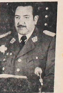
GEN. DAVID PADILLA ARACIBIA, jest drugim prezydentem Bolivi, po obaleniu rządu prezydenta Juan Pereda. Wszystko przemawia za tym, że nowy prezydent o przekonaniach praisocwicznych weźmie lewicę za cueg.

W amerykańskim departamencie stanu utrzymuje się przekonanie, że USA pozostawia Iran własnemu losowi, obiecując nowego sprzymierzeńca na Bliskim Wschodzie.