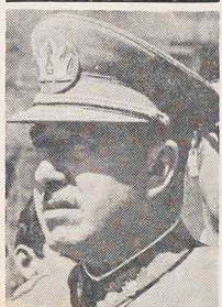
Prezydenci Argentyny i Chile: gen. Videla i gen. Pinochet zgodzili się na pośrednictwo Papieża Jana Pawła II, by rozstrzygnąć na drodze pokojowej spór o Kanał Beagle. Spór ten przetrwał ostatnio ostro między obydwojema państwami. Na zdjęciu: prezydent chilijski-Pinochet.

pozwolenie na powrót do kraju w brazylijskich ambasadach czy konsulatach.