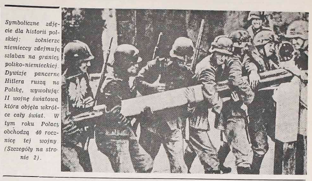
Symboliczne zdjęcie dla historii polskiej: żołnierze niemieccy zdejmują szlaban na granicy polsko-niemieckiej. Dywizja pancerna Hitlera rusza na Polskę, wyniszczyła II wojnę światową która objęła wkrótce cały świat. W tym roku Polacy obchodzą 40 rocznicę tej wojny (Szczegóły na stronie 2).

♦ WYDARZENIA W SKRÓCIE ♦ BRASILIA — Prezydent Figueiredo podpisał dekret - prawo zabraniający studentom uniwersyteckim należeć do organizacji nie mających nic wspólnego z życiem akademickim. ♦ BRASILIA — W ciągu 6 miesięcy br. brazylijski eksport produktów przemysłowych wzrósł do 16 procent. Mimo to małego spadku produktów rolniczych w wartościach dolarów. Roczny eksport osiągnął wartość 1,100 mld dolarów z tego 875 deezjalnych i 462 studentami. Małych zaś Seminariorów tych Seminariorów 2 430 studentów. Sióstr zakonnych jest 3.271, jest 57 liczących 2 630 studentów. Sióstr zakonnych jest 3.271. ♦ S. PAULO — Do 1981 roku stolica państwa otrzymała 85 autobusów do stacji kolejowej i koleki podprzewodnicze będą pasażerów w ten sposób transport kolejkowy. Ziemi, usprawniając w ten sposób transport kolejkowy. ♦ TEHERAN — Wspólny front przeciw rządowi Khomeini'ego tworzą różne organizacje Kurdów walczące o samostanowienie Kurdystanu, stanowiącego prowincję Iraku. Obiecana autonomia tej prowincji nie została dotąd wprowadzona w życie.