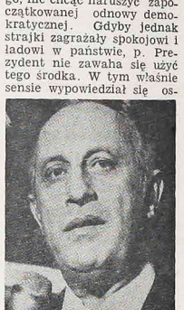
MURILU MACEDO — minister Pracy — interweniował osobście, by skłonić ugodowo z kilkoma strajkami, jakie miały miejsce w różnych stanach Brazylii.

Wpółnocno w różnych stanach Brazylii, są na razie zamoczone jako protest przeciw niskim zarobkom miesięcznym robotników, lekarzy, profesorów, urzędników stanowych itp. Wobec wzrostu inflacji i wysokiemu pensje otrzymywane są one są niedostateczne, by utrzymać rodziny żyjące w miastach wyłącznie z pensji. W większości wypadków strajki zostają zażegnane przez władze stanowe czy przedsiębiorstwa podniesieniem zarobków miesięcznych. Niektóre jednak strajki jak np. robotników budowlanych w Belo Horizonte czy w Porto Alegre przetrwały w zamieszki uliczne czy demontaż sklepów. Te właśnie strajki są niebezpieczne, bo mogą wywołać ostrą reakcję ze strony władz federalnych. Dotąd Prezydent Figueiredo nie skorzystał z prawa obojętności stanu wyjątkowe-