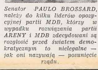
Senator PAULO BROSSARD, należy do kilku liderów opozycji partii MDB, którzy w wypadku rozwiązania partii ARENY i MDB zdecydowali się rozpoznać przed światem demokratycznym, że nielegalne — jak oni nazywają — posunięcie rządu.

Nobre — do Francji i Hiszpanii, a Teotonio Vilela do Stanów Zjednoczonych. Liderzy ci wiedzą, że rząd nie może im zabronić wyjazdu za granicę, lecz nie liczą się z tym, że rząd może im zagrozić prawem o Bezpieczeństwie Narodowym. Istnieje bowiem prawo, że podlega cieżkim karom ten, który zniesławia przed światem dobre imię i prestiż Brazylii. Tei karze podlegaliby liderzy MDB wygłaszając za granicą konferencje, udzielając wywiadów w prasie — krytykując rząd brazylijski i jego autorytet. Te wystąpienia liderów MDB miałyby na celu zmobilizować opinie krajów demokratycznych, by wpłynęła na zmianę stanowiska Prezydenta Figueiredo. Prezydent po dwakroć starał się namówić dyktator z partii MDB, lecz jego usiłowania spełniły na niczym. W kołach zaś wojskowych groźba rzucona przez liderów emendebistów jest komentowana jako zwykła prowokacja. Z tej strony emendebistów władza, że partia rządowa ARENY, choć w większości w Kongresie, nie ma prawa skonczyć z opozycją będącą w mniejszości! Trudno przewidzieć, jak się skończy obecny zatarg polityczny między rządem a opozycją.