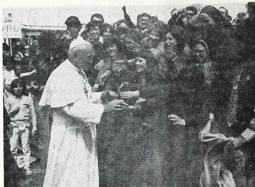
O Papa João Paulo II inicia, no próximo dia 29, a sua terceira viagem internacional como Pontífice.

Durante sua estada nos EUA, o Papa se alojará nas residências dos representantes diplomáticos do Vaticano e dos Bispos das cidades que visitar. No dia 7 de outubro, às 20 horas locais, partirá para Roma da base militar de Andrews.