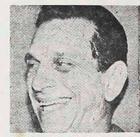
Minister Koppa i inżynier Cesar Cals, udzielił wywiadu prasie amerykańskiej podkreślił, że w 1985 roku Brazylia zredukują import nafty o 30 procent, dzięki wielkiej produkcji alkoholu oraz węgla drzewnego jako paliwa dla samochodów, autobusów, ciężarówek, transportowych i traktorów.

rowego wywiadu prasie amerykańskiej. Podkreślił on, że w 1985 roku Brazylia zredukują swe wydatki na import nafty o 30 procent tj. z obecnych 892 tys. bezcukle dziennie do 613 tys. W tym samym roku brazylijska produkcja alkoholu dojdzie do 10,7 miliardów litrów. Fundatorem Brazylii załazi 800 tys. hektarów ziemi drzewem energetycznym którego produkcja równać się będzie 120 tys. baryłek nafty dziennie. Tym paliwem będzie głównie węgiel wegetatywny. Wywiad ministra Calsa był prawdziwą rewolucją dla prasy amerykańskiej nie znającej planu brazylijskiego dążącego do rozwiązania kryzysu energetycznego. Objął on (czesz, że w przyszłym roku brazylijski przemysł samochodowy wyprodukować ma 250 tys. samochodów mających alkohol za paliwo. Natomiast przedsiębiorstwo Villares (czyli krajowe) jest już przygotowane, by w 1980 roku wyprodukować pierwsze motory dla ciężarówek i autobusów o napędzie wyłącznie alkoholowym. Będzie to duży krok naprzód w krajowej polityce energetycznej.