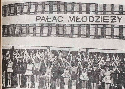
"PALAC MŁODZIEZY" — Fachada do Palácio da Juventude, uma modelar instituição de Varsóvia.

O Palácio da Cultura e da Ciência em Varsóvia constitui, desde a sua fundação, em 1955, o verdadeiro centro da vida cultural da capital polonesa. Embora Varsóvia se ufane de seus 30 teatros em funcionamento, dezenas de cinemas, centenas de bibliotecas e dezenas dos mais variados locais de diversão, justamente naquele Palácio é que têm lugar os mais interessantes empreendimentos, que incluem a maior parte dos participantes.