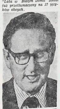
"Lata w Białym Domu" został już przetłumaczony na 17 języków obcych.

Były amerykański sekretarz stanu — Henry Kissinger wydał ostatnio 10 tom swych wspomnień. "Lata w Białym Domu". Publikację tego tomu poprzedziła festiwalowa impreza, podczas której Kissinger wygłosił przemówienie przez prasę, radio i telewizję. 11 tom ma się ukazać dopiero w połowie 1980 roku. Pierwszy tom zaś zawiera tematy jak: rokowania między USA i Wietnamem, skandale Watergate i upadek prezydenta Richarda Nixona. Pamiętniki Kissingera zawierają dane, by stać się nieocenionym źródłem opinii wyrażonych. Jedynym "ale" jest ich wysoka cena — 600,000 kruczej. Wydawnictwo TIME INC. zapłaciło Kissingerowi 5 milionów dolarów za nabycie manuskryptu. Zanim ukazał się oficjalnie, 10 tom tych wspomnień był już drukowany w formie książki kieszonkowej przez wydawnictwo TIME. 1 tom pamiętników