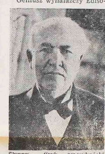
Słynny fizyk amerykański THOMAS EDISON jest autorem ponad tysiąc wynalazków, stojąc się przez to najwięcej wynalazcą wszystkich czasów. Wynalazki jego charakteryzują praktyczność i użyteczność.

W 1876 roku wynalazł mikrofon, w dwa lata później — fonograf, zaś w 1879 roku żarówkę. Jest także wynalazcą maszynki do telegrafu optycznego, udoskonalił akumulator, projektor, a w 1881 roku zbudował pierwszą elektrownię. Nie koniec na tym. Stworzył on podstawy do rozwoju techniki elektronicznej, jest twórcą pierwszych filmów amerykańskich na taśmie perforowanej (o szerokości 35 mm) i pierwszego filmu w 1893 roku. W tym czasie przedstawił tutaj wszystkie wynalazki Edisonsa, których liczba stanowi nieodcisły rekord — 1.033. Wśród tak wielkiej liczby wynalazków lampa elektryczna (żarówka) i tanie dostarcze-