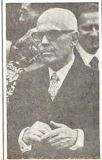
SANDRO PERTINI, 82-letni socjalista, został obrany ostatnio prezydentem Włoch na najbliższe 7 lat. Jego rodzice i dziadkowie żyli prawie sto lat.