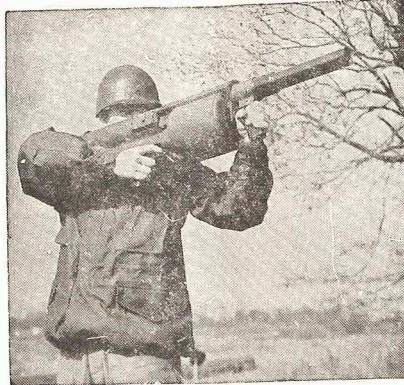
"A pessoa que nasceu depois de 1974 tem mais probabilidades de morrer assassinado do que um soldado na guerra".

Pedidos — Os religiosos pedem "a possibilidade de viverem em comunidade, o exercício livre de seu apostolado, a admissão livre de novos membros e sua instrução correspondente, a liberdade de terem e escolherem suas próprias casas como qualquer outro cidadão". Os superiores acentuaram "a convicção de não estarem pedindo nenhum privilégio a não ser a aplicação dos direitos humanos". (CIC).