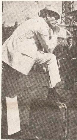
A maneira com que o homem vive hoje não lhe permite parar um pouco, pensar, descansar... aliás quase não permite.