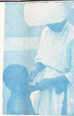
"O hábito não faz o monge"... mas pode ajudar no sentido de uma melhor identificação e, principalmente, num maior respeito às pessoas consagradas a Deus.

evangélicos". Os bispos declaram, entretanto, que "certas modificações podem ser adotadas, em função do tempo e do lugar", mas que não é permitido "deixar a cada irmã a possibilidade de escolher, segundo seu próprio gosto". Essa orientação às religiosas é feita — escrevem eles — para evitarem-se "certos abusos, causa de surpresa e de escândalo". (Ciec-SP).