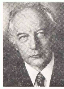
WALTER SCHEEL — prezydent Niemiec Zachodnich

W związku z wizytą prezydenta Geisela w Niemczech Zachodnich (od 5 do 9 marca br.) prasa brazylijska zamieściła obszernie artykuły o tym kraju, podając o nim szczegółowe dane. Dowiadujemy się więc, że Niemcy Zachodnie (Republika Federalna RFN) posiada 62 miliony mieszkańców (Niemcy Wschodnie 18 mln) i 284.574 km kw. powierzchni. Cudzoziemców jest tam około 4 milionów, głównie robotnicy wykwalifikowani. Na 1 km kw. przypada 244 osoby.