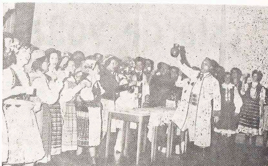
Fiagante do Casamento numa aldeia polonesa (Wesle Krakowskie) apre-sentado pelo referido conjunto folclórico.

a. 2 — Mas não são os Fundadores. — Todos aqueles que trabalharam efetivamente para o GRUPO du-