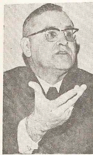
D. Paulo Evaristo Arns, o iniciador do I.º plano de manutenção do clero, o qual poderá ser a "semente" para outras Dioceses do Brasil".

"Todos os párcos, vigários cooperadores e valentes, em serviço na pastoral da Arquidiocese não tenham outra atividade remunerada, nem uma remuneração condigna de dois salários mínimos mensais livres. Haverá um acréscimo de por quinquênio de ordenação sacerdotal.