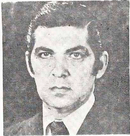
O governador Jayme Canet Júnior afirma que o Governo Federal vai amparar os produtores.

Fontes ligadas às cooperativas do Estado dizem que são incalculáveis, a esta altura, os prejuízos provocados pela estiagem, cujos reflexos deverão ser sentidos inclusive no plantio do trigo. Não chove em todo o Estado e quando acontece é de modo esporádico e sempre em quantidade insuficiente. Além dos elevados prejuízos provocados pela seca, os agricultores mostram-se descontentes com a redução nos percentuais de financiamento para custeio rural, aprovada na semana retrasada pelo Conselho Monetário Nacional.