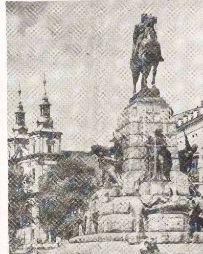
O famoso monumento do rei Ladislau Jagiello em Cracóvia, que em 1410 obteve grande vitória sobre a Ordem Teutônica dos Cavaleiros da Cruz (Krzyżacy), tendo como aliado o grão-príncipe da Lituânia — Vitoldo. No fundo as torres da catedral de Wawel.

Dos mais frequentados, especialmente pela classe estudantil, são o Castelo Real de Wawel e a famosa Universidade Jagiellona. Nesta os interessados aprendem história e fazem