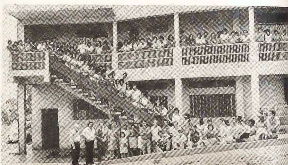
O entusiasmo e a disposição dos jovens em servir aos outros, principalmente aos pobres, foi constante neste 1.º Encontro Estadual em Apucarana.

O Segundo Encontro Estadual de Jovens Vicentinos deverá ser realizado aqui em Curitiba no ano de 1979. Esperamos que até essa data possamos já ter realizado um trabalho maior junto aos jovens para ingressá-los na Sociedade S. Vicente.