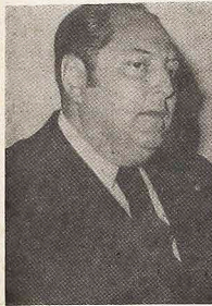
Aureliano Chaves, Governador de Minas Gerais, o futuro Vice-Presidente.

se candidatar, pela Arena também, à Presidência do Brasil.