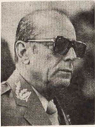
General João Baptista Figueiredo — Chefe do SNI — o futuro Presidente.

O General João Baptista Figueiredo, atual Chefe do Serviço Nacional de Informações, está confirmado