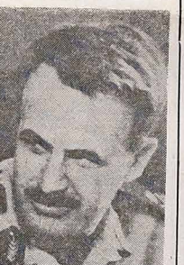
Prezydent Syrii HAFEZ ASSAD (na zdjęciu) zgodził się na przedłużenie obecności 1.200 żołnierzy ONZ (Błękitne Helmy) w Golanie na dalsze 6 miesięcy, stanowiących gwarancję dalszego rozejmu między Izraelem a Syrią.