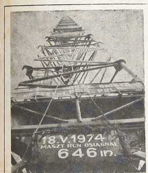
Zakończył się w ub. roku montaż najwyższego na świecie masztu w Radiofonicznym Centrum Nadawczym w Konstancynie koło Gubina. Ten gigantyczny maszt - antena wzmocni niepomierne zasięgi głównej polskiej radiostacji.

Wycofanie się USA z Indochin i niewywiązanie się z obowiązków powziętych wobec Cambodży czy Południowego Wietnamu stanowią smutny dowód, że na Amerykę nie można w pełni liczyć. Tragedia Południowego Wietnamu — jego upadek po 25-letniej krwawej i bezpardonowej walce — są obserwowane z wielkim niepokojem tak w Filipinach jak i w Izraelu. Zachodzi tu pytanie, czy w wypadku "być albo nie być" Filipin i Izraela — Stany Zjednoczone postąpią podobnie jak w Indochinach?