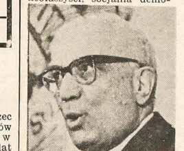
Lider włoskiej partii Chrześcijańskiej Demokracji Amintore Fanfani wyprawił się, ze chociaż jego partia wysłała osłabioną w ostatnich wyborach...