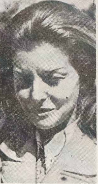
Dramatyczne chwile przeżywa obecnie Argentyna z powodu strajków i gwałtownych manifestacji ze strony robotników, którzy nie zgadzają się z oszczędnościową polityką szefa państwa — Maria Estela Martinez Peron.

Krytyczna sytuacja ekonomiczna Argentyny zmusiła prezydenta Isabelite do zwiększenia salaria minimum tylko o 50% zamiast wymaganych 130% przez syndykaty robotnicze. To zarządzenie Isabelite wywołało strajk generalny oraz żywe protesty ze strony tak syndykatów jak i Generalnej Konfederacji Pracy (CGT). Był to kres strajków i demonstracji, pani prezydent odbyła konferencję z kierownikami CGT, której wynikiem jest dotychczas.