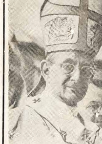
Święto Apostołów św. Piotra i Pawła (przypadające w ub. niedziele) było Dniem Papieża. Celi świat chrześcijański uczył ten dzień gościć naszymi modlitwami w intencji Ojca św. Tyśiące pielgrzymów, którzy złożyli synodusi, wiodli Głowie Kościoła Katolickiego, zalegające szczerze odbrzyli plac przed bazyliką św. Piotra i Pawła — otrzymali od Pawła VI papieskie błogosławieństwo.

Ministrowie spraw zagranicznych: brazylijski min. Azevedo da Silveira oraz niemiecki Hans Dietrich Genscher podpisali dnia 27 czerwca br. traktat o współpracy na polu energii atomowej. Akt ten odbył się w siedzibie Międzynarodowej Agencji Atomowej.