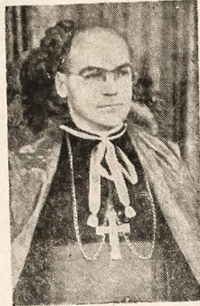
A viagem de D. Pedro (a obrigação dos bispos prestar contas ao papa a cada cinco anos é chamada de "visita ad limina" — visita aos pés de São Pedro) — no Rio de Janeiro.

Que os bispos brasileiros continuem próximos ao povo; que os padres carreguem com amor a cruz do sacerdócio, agindo com sacrifício e imolando-se em favor do povo; que os religiosos, com coragem e dedicação, deem testemunho de vida consagrada à causa de Cristo; e que os leigos procurem viver seu batismo.