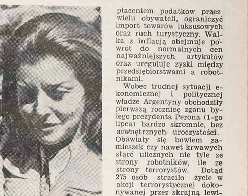
Dramatyczne chwile przeżywa obecnie Argentyna z powodu strajków i gwałtownych manifestacji ze strony robotników...

Krytyczna sytuacja ekonomiczna Argentyny zmusiła prezydenta Isabelitę do zwiększenia salaria minimumo tylko o 50% zamiast wymaganych 130% przez syndykaty robotnicze.