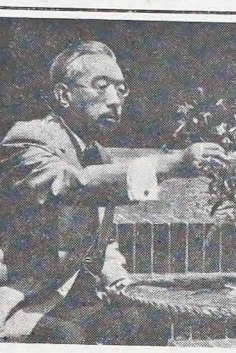
Cesar Japoni Hiroito z małżonką Nagako (na zdjęciu) obchodzą niedawno złote urodziny. Cesarz ma 72 lata, a cesarzowa — 70 lat. Z tej okazji odbył się bankiet w pałacu cesarskim w Tokio z udziałem 120 zaproszonych gości.

glosie istniejącej między Lizboną a Moskwą Transamazonica ukończona została w rekordowym terminie: trzy lata i cztery miesiące. Dzieli się ona na trzy odrębne odcinki: a) przebiega Nordeste Pernambuco, Ceará, Piauí i Maranhão — licząc 1.570 km. b) wychodzi z miejscowości Estreito i biegnie przez