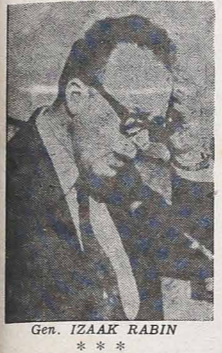
Gen. IZAAK RABIN