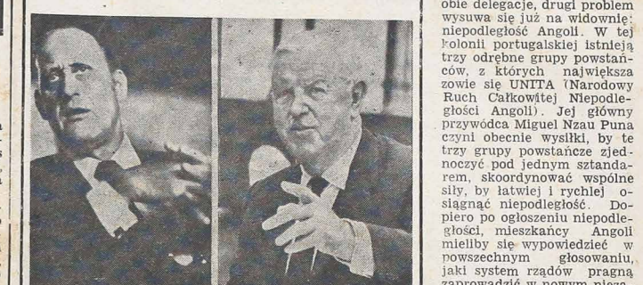
Dnia 11 czerwca br., a więc na dwa dni przed rozpoczęciem rozgrywek Światowych Mistrzostw Piłki Nożnej, odbył się w Frankfurtie wybór nowego prezesa Światowego Związku Piłkarskiego (FIFA)...