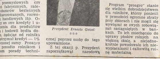
Prezydent Ernesto Geisel

Program "proagro" stanie się wielkim dobrodziejstwem dla rolników, którzy ponieśli w przeszłości ogromne straty przy zbiorach... (text continues with details of the agricultural insurance program)