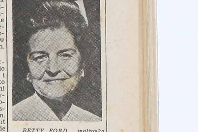
BETTY FORD, małżonka prezydenta Stanów Zjednoczonych (na zdjęciu), opuściła już szpital po podaniu się operacji narosła o podłokic rakowemu na pierś. Mówi się, że kandydatka prezydenta 1976 na szefa USA w wyborach 1974, zależeć będzie od stanu zdrowia Betty.

EKSPORT TEN MOŻE STAĆ SIĘ BRONIĄ W RĘKU USA