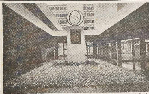
widnieje następujący napis: "A Universidade de São Paulo — a Coletividade Polonesa radicada nesta Capital". (Szczegóły na str. 2).

Na konferencji powyższej uznano, że nafta arabska stała się skuteczną bronią polityczną, by zmusić państwa wspomagające Izraela do zachowania całkowitej neutralności. Z drugiej zaś strony państwa arabskie poczynić muszą skuteczne kroki, by stawiąc czoło wielkiej wyższej cen europejskich produktów importowanych przez Bliski Wschód. Dlatego należy zaopatrzyć obficie w naftę jedynie te państwa europejskie które stoją po stronie państw arabskich w ich konflikcie z Izraelem.