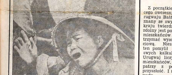
Toczyła się od kilkunastu lat wojna w Wietnamie pochłonięto miliony ofiar w ludzkości. Obecnie się, że tak Wietnam Południowy jak i Północny stracili milion ludzi każdy — wliczając w to żołnierzy i ludność cywilną. — Na zdjęciu widzimy młodą matkę rozpaczającą nad zabitym dzieckiem.