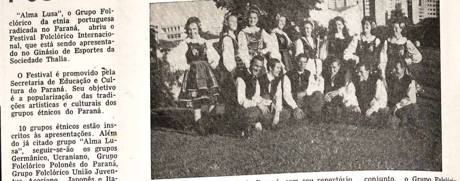
“Alma Lusa”, o Grupo Folclórico da etnia portuguesa radicada no Paraná, abriu o Festival Folclórico Internacional, que está sendo apresentado no Ginásio de Esportes da Sociedade Thalia.