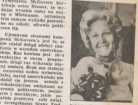
Patricia (Pat) Nixon, 60-letnia małżonka prezydenta Nixona — suą prostotą i uśmiechem zdobyła wyobrobia dla męża.

dotąd 30 miliardów dolarów może dojść wkrótce do 100 miliardów dolarów. Partia Republikańska rozpoczęła pocztą 93 miliona listów do wyborców pochodzących z zamieszkałych w Stanach Zjednoczonych, by zyskać ich głosy. Wyborcy ci rekrutują się głównie ze stanów: New Jersey, Pensylwania, Kalifornia, Illinois, Nowy Jork, Teksas, Maryland, Ohio i Connecticut. Tymczasem McGovern krytykuje oskarżenia Nixon, że wydatki wyszły sumy na wojnę w Wietnamie, ograniczenia tym samym wydatki potrzebne na szkoły, zdrowie publiczne itp.