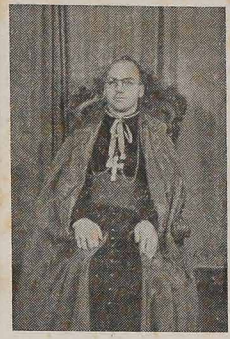
Ks. arcbp. D. Pedro Fedalto

sze zaś w Centralnym Seminarium Ipiranga — w São Paulo. Święcenia kapłańskie otrzymał w Kurytybie w roku 1953.