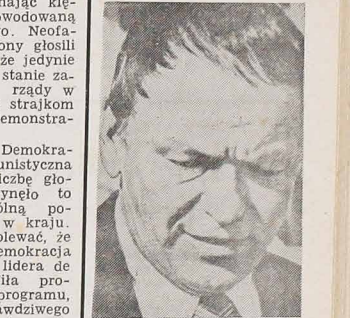
Frank Sinatra, popularny śpiewak i aktor filmowy, występujący od lat na estradach i w kinach USA. Widać go na posępnym bankiecie dla gwiazd i gwiazdorów Hollywood. Sinatra wycofuje się deklinacyjnie z życia artystycznego.

Wybory administracyjne, jakie odbyły się ostatnio w 150 gminach włoskich z udziałem 7 milionów wyborców, przyniosły ogólnie niespodzianki, znaczny wzrost partii neofaszystowskiej (MSI). W wielu gminach przetrwały w mocy rządy w nocy, kładąc kres strajkom i gwałtownym demonstracjom. Chrześcijańska Demokracja — partia komunistyczna straciła znaczną liczbę głosów, choć nie wypłynęło to decydująco na ogólną pozycję tych partii w kraju. Należy jedynie ubolewać, że Chześcijańska Demokracja od śmierci swego lidera de Gasperi i pod kierunkiem prowadzącego daleki program, tj. wyzwoleń prawdziwego systemu demokratycznego nad programem socjalistycznym. Partia ta wyciągnęła rękę do lewicy osłabiając tym sposobem swój wpływ, znaczenie i prestiż w narodzie, lecz na centrum — nie odniosła skutku. Colombo zwrócił także uwagę głoszących na silną propagandę Apel do wyborców skierowany w przeddzień wyborów z lewicy Colomby, by nie głosowano na lewicę, lecz na centrum — nie odniósł skutku. Colombo zwrócił także uwagę głoszących na silną propagandę