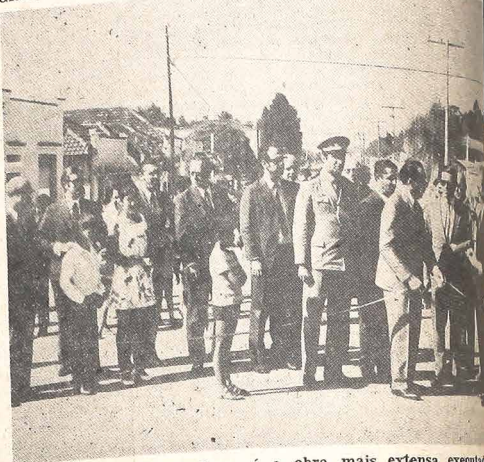
A nova Mateus Leme é a obra mais extensa executada pela atual administração.

técnica aprimorada, incluindo, também, os serviços de meio-fio, sarjeta e drenagem completa.