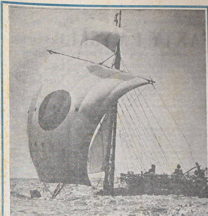
Słynny podróżnik norweski — Thor Heyerdahl, na łodzi zbudowanej z papierusu "Ra-2" razem z 7 towarzyszami, zdołał przepłynąć Atlantyk, potwierdzając swą hipotezę, że Amerykę odkryli Egipcjanie a nie Kolumb.