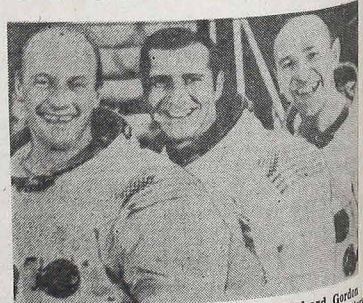
Os astronautas Charles Conrad, Richard Gordon e Alan Bean, pilotarão o Apolo 12 no próximo dia 14. O local do pouso na Lua será uma cratera. Permanecerão lá por mais tempo que seus predecessores, explorando o solo lunar.