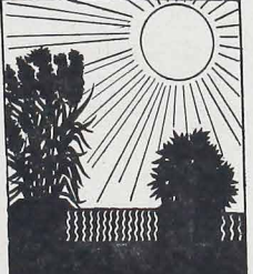
da água que é necessária para as variedades comuns.

Um dos meios de poupar água é o aperfeiçoamento de plantas que exigem menos humidade. A fundação descobriu um produto químico que reduz o tamanho dos pés de algodão sem diminuir a sua produção. O projeto ainda está na fase experimental, mas as plantas resultantes dos testes dão uma produção normal, com metade