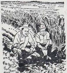
maior do que as chuvas poderiam compensar.

Desde o início, a Fundação de Pesquisas do High Plains procurou aperfeiçoar as maneiras de aproveitamento das quantidades limitadas de água. A irrigação foi feita com água bombeada de poços profundos. Mas até mesmo a água dos poços tinha que ser usada com parcimônia, para evitar um consumo