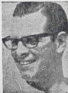
O governador Paulo Pimentel enviou à Assembleia Legislativa a proposta orçamentária anual do Estado, para o exercício financeiro de 1969. A mensagem estima a receita e fixa a despesa do Estado. — Poderes Legislativo, Judiciário e Executivo — em 920 milhões de cruzeiros novos, ou seja quase um trilhão de cruzeiros antigos. O governo consigna a soma de 153 milhões para o setor de educação e cultura — superior ao orçamento total de pelo menos três Estados brasileiros.

Estas são as informações oficiais do Grupo de Trabalho, que continua à disposição da imprensa, para outras informações adicionais.