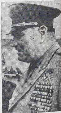
O marechal Ivan Jakubovskiy comandante em chefe do Pacto de Varsóvia, inspecionou, nestas dias, as tropas soviéticas aquarteladas na Checoslováquia. Afirmou-se que 10 divisões russas "guarnecerão" o solo checo.