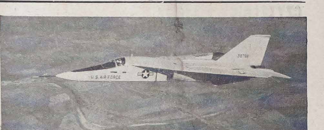
Amerykański odrzutowiec myśliwski "F-111" posiada skrzydła ruchome zwiężające się w locie pełnym; przy starcie zaś i lądowaniu rozkładają się stosownie do lotu, którego maksymalna szybkość dochodzi do 2,5 razy większej aniżeli szybkość glosu.