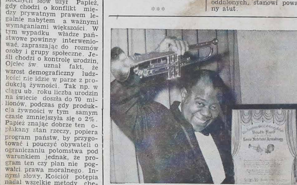
Louis Armstrong, sławny amerykański muzyk "jazzu", ukończył niedawno 50 lat swej działalności artystycznej. Znany on jest na całym świecie ze swych liczących występow, z których dochód przeznaczano dla biednych studentów. Z racji swej oryginalności