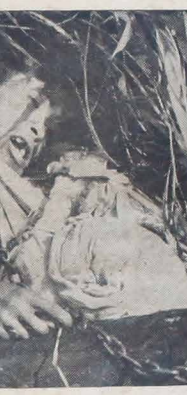
Bezbolesny w swej akcji Wietkong traktuje w nieludzki sposób jeńców, zwłaszcza tych, którzy mu odmawiają "haraczu" płaconego w pieniędżach lub w postaci ryba. Na zdjęciu jeńcy Poludn. Wietnamu zastrzelony przez Wietkong, torturowany uprzednio w okrutny sposób.

Kilka batalionów Korei Południowej walczących w Wietnamie stały się już pułkami w szeregach Wietkongu. Żołnierze południowo-koreańscy używają w walce metod partyzanckich, zakładając miny i przyszykując różne zasadki na szlakach odwrotnych przez Wietkong. Ponadto pracują razem z wiesniakami na roli, dając im osłone wojskowa oraz ucząc ich niezawodnych sposobów w obronie osobistej.