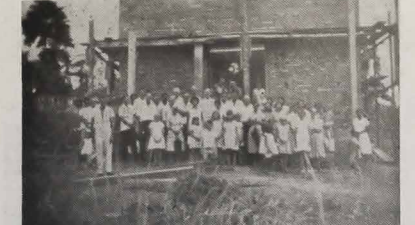
Grupa Rodaków z Águia Branca przed kościołem będącym w budowie