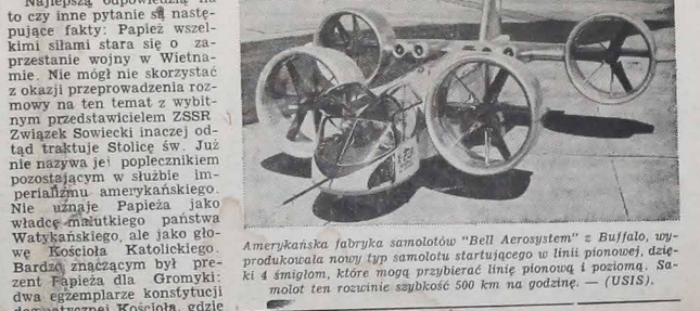
Amerykańska fabryka samolotów "Bell Aerospace" z Buffalo, wyprodukowała nowy typ samolotu startującego w linii pionowej...