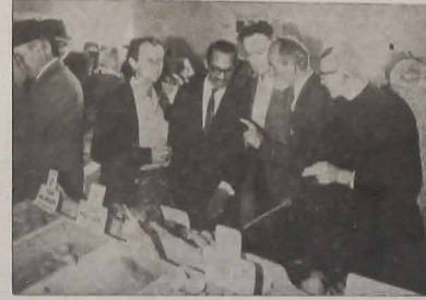
Wspaniała towarzysza ziemniaków odbyła się w Dom Pedro, dnia 10 lipca br. — Szczegóły na stronie 7

W gwałtownych starciach między policją a murzynami na ulicach Chicago zginy 2 osoby, 48 odniosło rany, a 187 zostało aresztowanych. Zająca te wywołali murzyni, którzy wbrew zakazom władz policyjnych urządzali sobie prawdziwą kapiel przy publicznych kranach, umieszczonych na ulicach i placach miasta, wobec niezgodnych upałów dochodzących do 35 stopni.