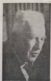
O Brasil está hospedando atualmente Arnold Toynbee, o qual foi convidado pelo Itamarati para que visitasse a nova terra e a nova gente. É conhecido como historiador mas, principalmente como filósofo, que alcançou um renome internacional através de sua monumental obra "A Study of History". O famoso cientista inglês deverá passar pelas principais cidades brasileiras, o que esperamos ser-lhe-dá de grande proveito.