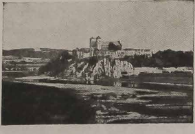
BÓCA TORTA E O TESTAMENTO