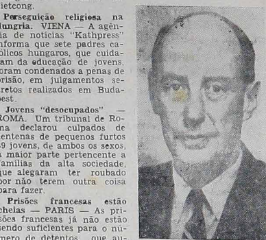
A morte repentina de Aklai Stevenson teve profunda repercussão no mundo inteiro