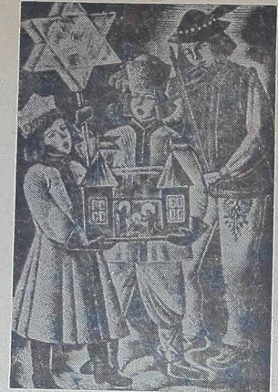
O Ano Novo na Polónia é saudado pelos grupos de rapazes "gwiazdzy" que, carregando uma grande estrela luminosa visitam os moradores do interior do país, cantando os cânticos natalinos "desejando-lhes Feliz Ano Novo".