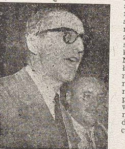
Arturo Frondizi, prezydent Argentyny uległ presji dowódców Sił Zbrojnych i zerwał stosunki dyplomatyczne z Kubą.