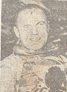
Astronauta pułk. Glenn

kiem, połudn.-wschodnią Afryką, Madagaskar, Ocean Indyjski, Pacyfik, Australię,