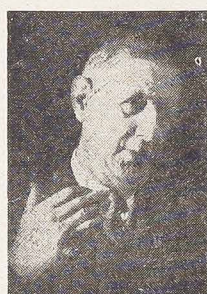
Potrójnym zamachu dokonali terrorysty francuscy na prezydenta de Gaulle. Z uszkodzonych tych zamachów, prezydent Francji w cudowny sposób uciekł z życiem.

Ben Bella stał się faktycznie panem sytuacji w Algierze. Marsz jego oddziałów na stolice kraju odbył się bez trudu, ponieważ garnizon III Armii w Algierze nie chciał walczyć z Ben Bella. Kłopoty polityczne bez odwołania sprasły się bezowocnie, że garnizon ten stracił swoje znaczenie w kraju. Z pewnością będą się negocjowały z Ben Bella o korzystniejsze warunki polityczne. W interwencji natomiast Algieru odbywała się starcia między dwoma przeciwnymi ugrupowaniami, w których do akcji wzięli wojskownicy i kaminiarze, bezwzględnie zastępcą Ben Belli, Mohammed Kidder zapewnił domowi korespondentów zagranicznych, że Ben Bella odwołanie w ręce przywrócenia Narodowego, gdy ci ci w Algierze i że najbliższe wybory odbędą się do bieżącego miesiąca.