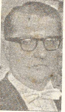
MIN. AFONSO ARINOS

W wywiadzie udzielonym korespondentom krajowym i zagranicznym, nowy minister Spraw Zagranicznych Brazylji, Afonso Arinos, narkreślił nowy kierunek polityki zagranicznej państwa, stosownie do programu prezydenta Jania Quadros, a mianowicie: a) dyplomatycznie przedstawiciele Brazylji za granicą będą się starali w sposób więcej dynamiczny o nawiązanie licznych kontaktów handlowych z krajami całego świata celem zwiększenia eksportu brazylijskiego do innych państw. b) Brazylia utrzymywał będzie stosunki dyplomatyczne z wszystkimi krajami świata, m.in. z Rosją i Chinami komunistycznymi. (O polityce z Rosją wspominał Arinos). c) Brazylia starać się będzie nadal o współpracę z Unią Państw Amerykańskich (OEA), której celem jest wspólny wysiłek o ekonomiczny rozwój oraz obrona żywotnych interesów tychże państw.