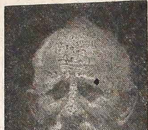
ści wielkiej ilości ludzi, poho- wano go uroczyste na ementa- riu przy kaplicy Matki Boskiej Czestochowskiej, gdzie prze- żył lat modlił się i opiekował

Caxias. Z Caxias do Sul wysła- no go do Antonio Prado, gdzie w roku 1899 ożenił się, skąd się w roku 1811 przeniósł na „Li- nha Geral Velha”, Mun. Casca.