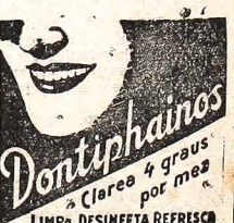
Dentiphainos Limpia Desinfeta Refresca

de Henrique Listkiewicz CONSERTA-SE: Máquinas Industriais, Compressores de ar, Motores a gasolina e Diesel, Motores de popa, Caçambas, Macacos e Amortecedores. Caminhões e automóveis de todo tipo. Pintura e lataria. Solda e serviço de torno. Serviço garantido. - Rua Nunes Machado, 300, tel.: 4-1826, - (perto do Corpo de Bombeiros).