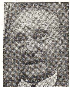
KONRAD ADENAUER, kanclerz Niemiec Zachodnich

Jeszcze raz de Gaulle zwyciężył w niebezpiecznej dla Francji "grze", która była ostatecznym zwycięstwem kilku francuskich generałów i pułkowników, co ma być dowodem na to, że de Gaulle, na wieść o buncie, zarządził natychmiastową mobilizację, zaapelował do wojska stacjonowanego w Algierze, podniósł na nogi lotnictwo. Wydał proklamację do całego narodu, żądał uwiecznić w miejscach wszystkich wojskowych podejrzanych o sprzyjanie buntownikom. Jedynym słowem - wygrał. W ten sposób zwyciężył już się zarysowywuje. De Gaulle, na wieść o buncie, zarządził natychmiastową mobilizację, zaapelował do wojska stacjonowanego w Algierze, podniósł na nogi lotnictwo. Wydał proklamację do całego narodu, żądał uwiecznić w miejscach wszystkich wojskowych podejrzanych o sprzyjanie buntownikom. Jedynym słowem - wygrał. W ten sposób zwyciężył już się zarysowywuje.