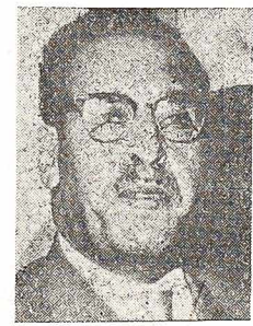
FERHAT ABBAS, przywódca ruchu niepodległościowego w Algierze.

za usunięciem sekretarza ONZ są tylko państwa Bloku komunistycznego, wycofała ten projekt. Tym samym - polityka sowiecka