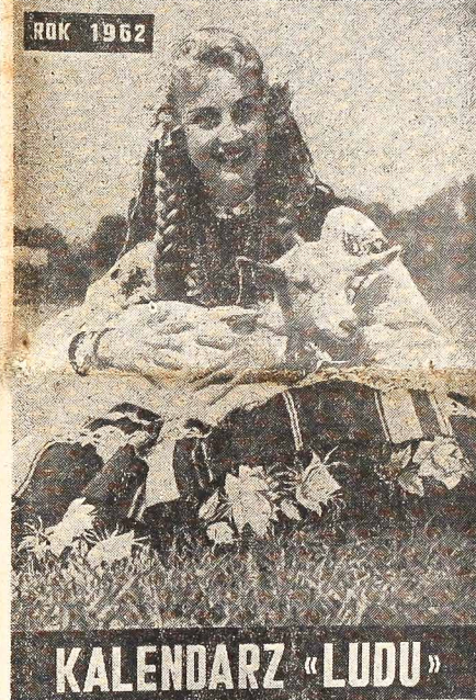
Tak będzie wyglądała okładka Kalendarza "LUDU" na rok 1962.