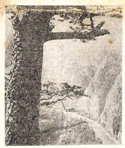
Z ozyku — Poznaj Polskę: Wspaniały widok rzeki Dunajec — w Pieninach

★ WSZYSTKICH HOLENDRÓW JEST W PARANIE około 1.400 osób. W większości swej są oni rolnikami i zamieszkałymi miejscowości: Castrolandia, Monte Alegre, Carambei, Tronco i Arapatii.