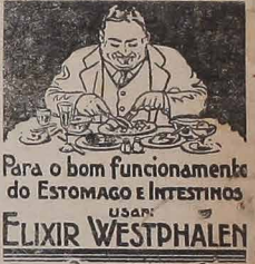
Para o bom funcionamento do Estomago e Intestinos usar ELIXIR WESTPHALEN

AUDYCJE POLSKIE w każdą niedzielę o godz. 13.45 "Rádio Legendaria da Lapa".