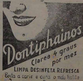
LIMPA DESINFETA REFRESCA Gota a carne e cura o mau hálito