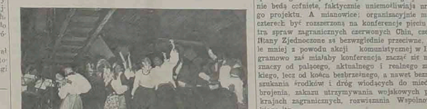
Z KONGRESU CHORU „Rozważona Karzema”

W związku z wywołaniem strajku przez pracowników Krajowej Komisji Wydziałowej Krajowej Komisji Wydziałowej