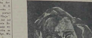
Portret jednego z artystów wystawy w Domu Polskim.

Wielki jubileusz sześćdziesiąty rocznicy odzyskania niepodległości przez Polskę jest okazją do podsumowania naszego życia kulturalnego w ostatnich latach. W tym celu należy przede wszystkim spojrzeć na zagranicę, gdzie nasze dzieła i myśli znajdują się w różnorodnym środowisku.