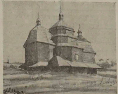
"Z polskiej architektury" — Cerkiewka w Czornobylu.

świata i przedstawicieli Sowietów, jako "przedłużający kraj pokojowej pracy i walki o pokój", zjawia się nowa fala sprawdzająca propagandową ofensywę gospodarczą, aby zrobić solidarność świata zachodniego i dokonać wyłomu w blokadzie gospodarczej, jaka pod przewodnictwem Stanów Zjednoczonych zaczęła się wokół bloku sowieckiego. Dla złamania tej blokady bolszewicy przygotowują do zorganizowania jeszcze jednej międzynarodówki przywrócić im kierownictwo. Tym razem będzie to "komunistyczna międzynarodówka kapitalistów i przemysłowców".